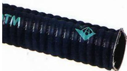
Trellvac Extractor HD

SUGSLANG. Cdust Light. Lätt och flexibel gummislang för slitande material, med stålspiral. Levereras i längder på 10–eller 20 meter.