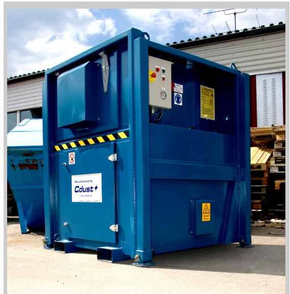
CVU 11/16,5 kW

Levereras i målat utförande, motsvarande miljöklass C2, standardkulör RAL 7035 ljusgrå.